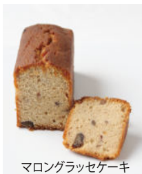
マロングラッセケーキ