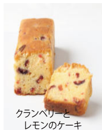
クランベリーと レモンのケーキ