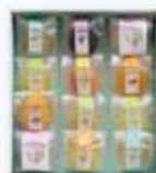
ゼリーギフト 12個入 ¥3,850(税抜)