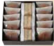
黒豆涼菓 (大) ¥3,800 (税抜)