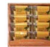
ココナッツカステラギフト 8個入 ¥2,300(税抜)